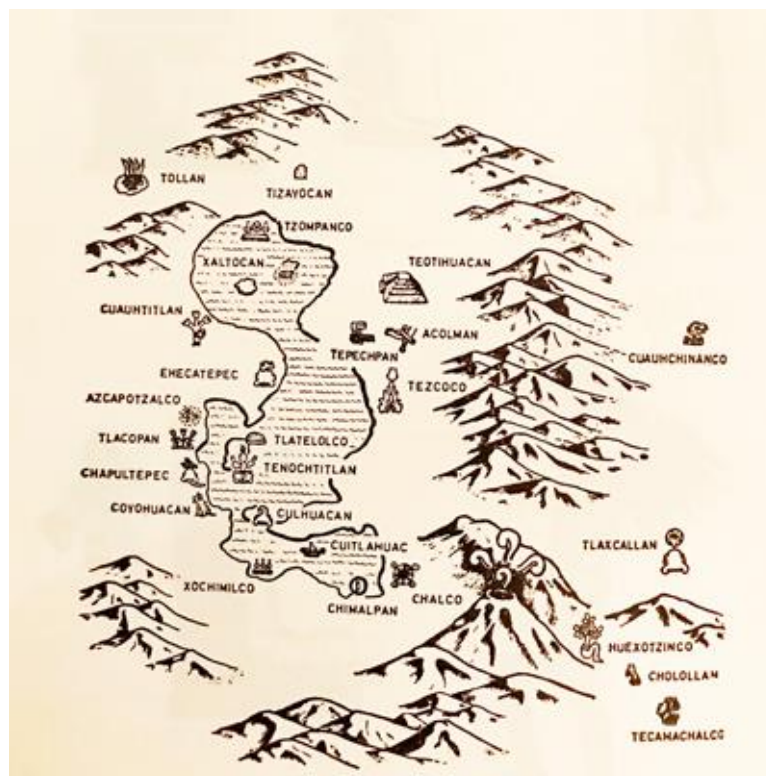
Valle de México. V. M. Castillo. Nezahualcóyotl: Vida y Obra.

En el siglo XV, debido a la facilidad de comunicaciones que permitía el Lago de Texcoco, al lado de la ribera se hallaba densamente poblado. Desde allí, las tierras no permitían sobrevivir a las personas ni los cultivos, algunas tribus iniciaron una expansión territorial hacia zonas con mayor rentabilidad agrícola, lo cual provocó una serie de guerras infinitas. Entre ellas, destacaron las encabezadas por los tepanecas de Azcapotzalco. Porque esta ciudad situada en la ribera noroccidental del lago de Texcoco había agotado sus tierras comunales, que no podía alimentar a sus habitantes. De este modo, Tezozómoc, el señor de Azcapotzalco decidió invadir las zonas de su vecino, Texcoco.