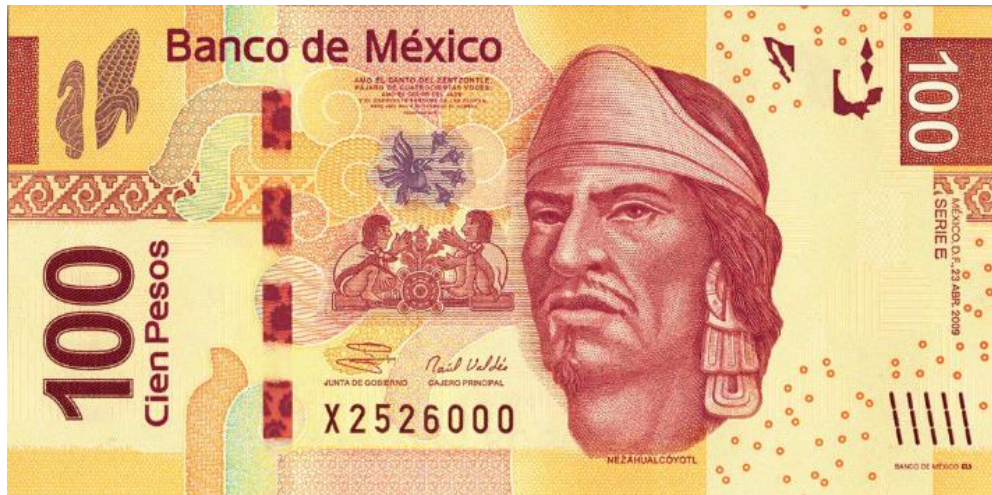
Un billete de 100 pesos mexicanos.

En el año 2005, su nombre fue inscrito con letras de oro en el muro de honor de la Cámara de Diputados del Congreso Mexicano. En el año 2013, en el acto para conmemorar el Día Internacional de la Lengua Materna, en el Museo Nacional de Arte, se presentó una aplicación gratuita para iPad dedicada a la obra poética de Nezahualcōyōtl, incluido un facsímil digital de las primeras transcripciones conservadas de los cantos prehispánicos y un cómic del rey poeta de Texcoco. En el año 2017, Raymundo Juárez produjo una película animada sobre él que se llamaba Nezahualcōyōtl, la gran historia . Respondiendo a la pregunta sobre por qué hizo una película así, dijo el director, “Realmente, mucha gente ya no conoce a los héroes, no conoce a los héroes de independencia, pues, mucho menos la historia prehispánica. Pues esa inquietud me llevo precisamente a realizar la película. Pero no vamos a conformar con que cuando a un niño le pregunten quién es Nezahualcōyōtl, pues no digan que es un municipio o que es una estación del metro.” En el año 2018, el presidente municipal de Texcoco Jesús Adán Gordo Ramírez rindió el homenaje a Nezahualcōyōtl acompañado del cuerpo de Gobierno y directores de la administración municipal en el monumento al Nezahualcōyōtl.