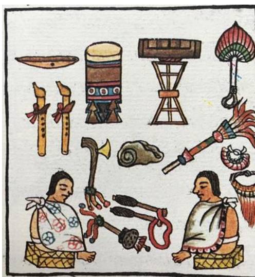
Casa de canto. Códice Florentino .

Segundo, la poesía es un símbolo de una vida civilizada, “para los antiguos pueblos nahuas, una ciudad comenzaba a existir cuando se establecía en ella el lugar para los atabales (tambores), la casa del canto y el baile.” 22 Así que eso significa que las poesías iban acompañadas con canto y danza, principalmente, eran para las fiestas de los templos, o para los reyes y los nobles.