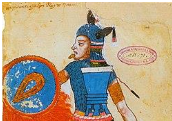
Nezahualcóyotl. Anónimo. Wikimedia Commons.

Nezahualcóyotl, su nombre completo era Acolmiztli Nezahualcóyotl, nombres que significan “brazo o fuerza de león y coyote hambriento respectivamente” 2 , fue el soberano chichimeca de Texcoco, que sostuvo muchas identidades durante su legendaria vida. Entre ellas, por su gran interés por el arte y su genio intelectual es más conocido por el nombre de Rey Poeta , que escribió muchas poesías por las que expresó sus pensamientos y reflexiones sobre la tierra, la vida, la humanidad y la divinidad, lo cual deja una gran cantidad de patrimonios culturales a los intelectuales de la actualidad por estudiar el mundo prehispánico en muchos aspectos. Además, como un gobernante de Texcoco de gran capacidad, al mismo tiempo dedicó mucho tiempo a los campos de la filosofía, las guerras, la energía hidráulica, la arquitectura y la legislación. Sobre sus referencias, según Miguel León-Portilla, son fuentes principales “ Los Anales de Cuauhtitlan , las obras de los historiadores texcocanos Ixtlilxóchitl y Pomar, así como, con carácter de secundarias, las relaciones e historias de Fray Juan de Torquemada y de Chimalpain Cuauhtlehuanitzin.” 3