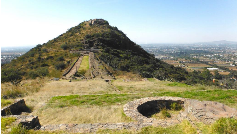
Bosque de Tetzcutzinco.