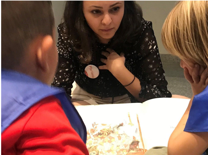
Fotografía 5. Dialogando sobre el libro Salvaje.

Yo realizaba las lecturas de forma autónoma con los niños, sin embargo, para realizar una evaluación fueron invitados a cinco educadores del museo para acompañarme en sesiones diferentes de lecturas. Los educadores participaron como oyentes y al final rellenaron una encuesta de evaluación a partir de lo que habían observado. El ideal sería haber realizado la evaluación con todos los ocho educadores, pero en el periodo cuando fueron aplicadas las encuestas parte de los educadores estaba de vacaciones.