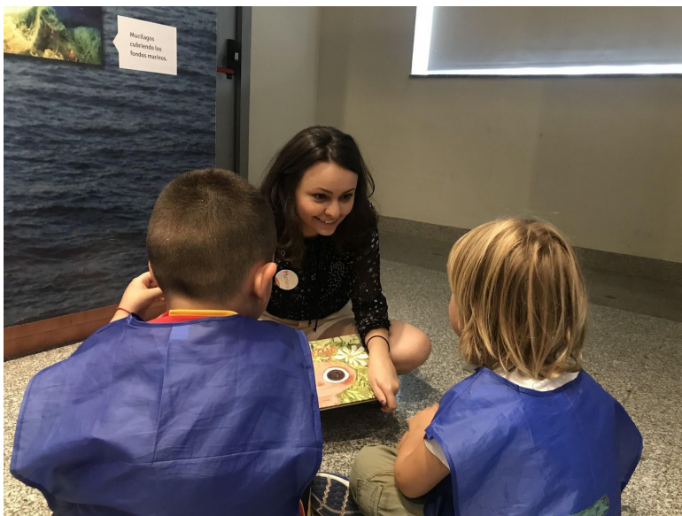
Fotografía 4. Lectura dialógica en las salas del MNCN.

La actividad fue realizada a lo largo de siete semanas del campamento, con grupos de cuatro o cinco participantes, y en total asistieron cincuenta y cuatro niños y niñas, en las fotografías 4 y 5 se puede ver momentos de la lectura.