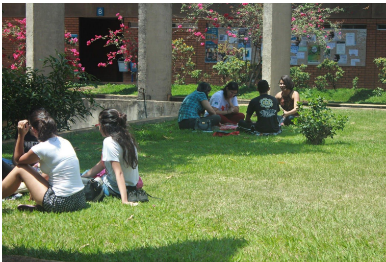
Fotografía 2. Lectura dialógica en la Universidad de Brasilia.