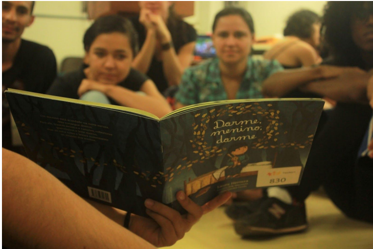
Fotografía 1. Lectura dialógica con adolescentes.