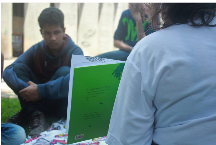
Fotografía 3. Discutiendo el Árbol Generoso con adolescentes.