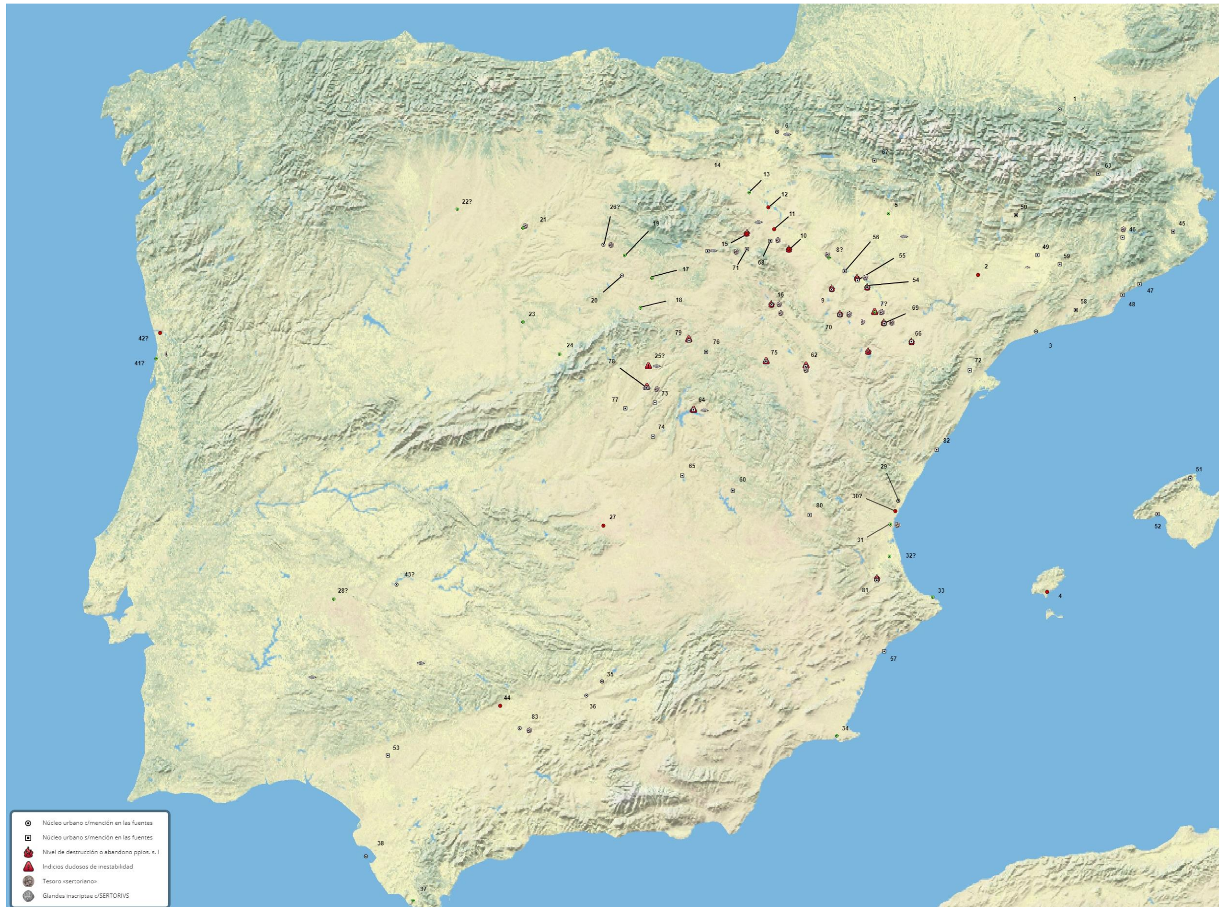
Figura 3b. Tesoros, glandes inscriptae y niveles de abandono o incendio a los que se ha atribuido una datación sertoriana. Puede apreciarse la superposición de varios de estos indicadores en los mismos sitios arqueológicos, en ocasiones no mencionados en absoluto por las fuentes escritas: es el caso de La Muela de Alcocer-Castro de Santaver, Guadalajara, nº 64), La Muela de Taracena (Taracena, Guadalajara, nº 78), Los Rodiles (Cubillejo de la Sierra, Guadalajara, nº 75), La Caridad (Caminreal, Teruel, nº 62), Castillejo de La Romana (La Puebla de Híjar, Teruel, nº 69), Piquete de la Atalaya (Azuara, Zaragoza, nº 70) y La Corona (Fuentes de Ebro, Zaragoza, nº 54). Ello proporciona una base razonable sobre la que proponer la implicación directa de estos oppida en el conflicto sertoriano. Mapa accesible e interactivo online: https://www.scribblemaps.com/maps/view/DavidGarcíaDomínguez/BasedatosTFM .