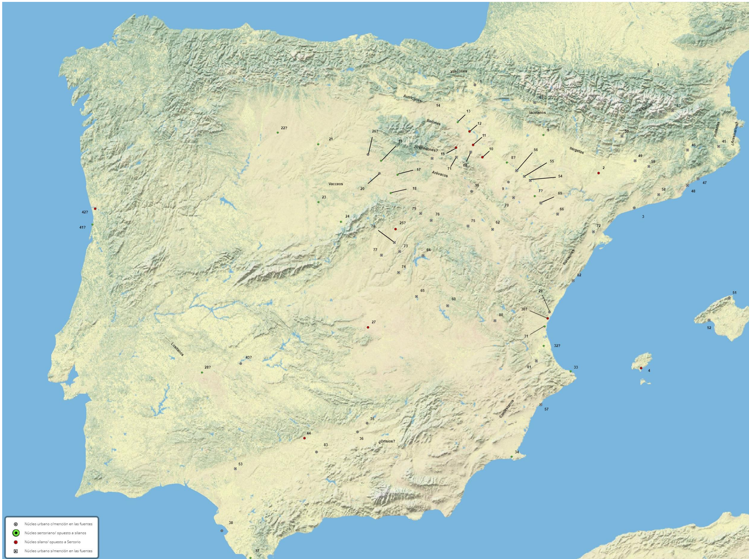
Figura 3a. Ubicación en el mapa de los topónimos mencionados por las fuentes escritas sobre Sertorio. Se indican también aquellos núcleos urbanos no mencionados en el registro escrito pero que pudieron jugar un papel relevante en el conflicto, en particular, las ciudades de nueva fundación y los sitios arqueológicos que conocen trabajos de urbanismo en la cuenca del Ebro después de 133 a.C. También incluimos los centros en cuyas inmediaciones se documentan trazas materiales de inestabilidad a principios del s. I a.C. y los oppida del corredor del Henares donde se documentan procesos de concentración poblacional en vísperas del conflicto sertoriano. En los casos de reducción toponímica dudosa, hemos optado por la ubicación más aceptada, señalando su precariedad en la lista de topónimos adjunta (figura 3c). Mapa accesible e interactivo online: https://www.scribblemaps.com/maps/view/DavidGarcíaDomínguez/BasedatosTFM .